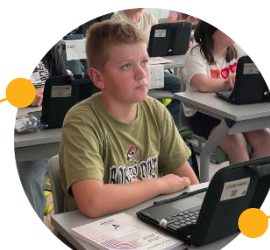
Inhaalles Fr., Ned. en wisk.