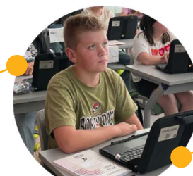
Inhaalles Fr., Ned. en wisk.